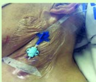
Curativo posterior; filme transparente. Permanência máxima: 7 dias 1º opção de fixação - Dois pontos na presilha + dois pontos no Y