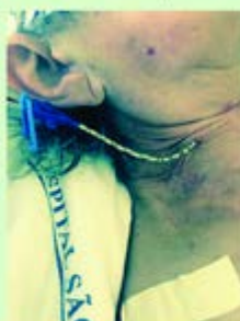
2º opção de fixação: Se não for possível fixar o Y - Bailarina