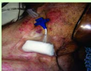
Curativo no 1º dia - gaze Observe o Y fixado com 2 pontos