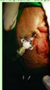
Fixação correta da DVE